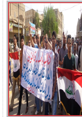
دراوردن نه‌ه‌فت کوردستان له‌ به‌رزه‌وه‌ندی کی پوی؟