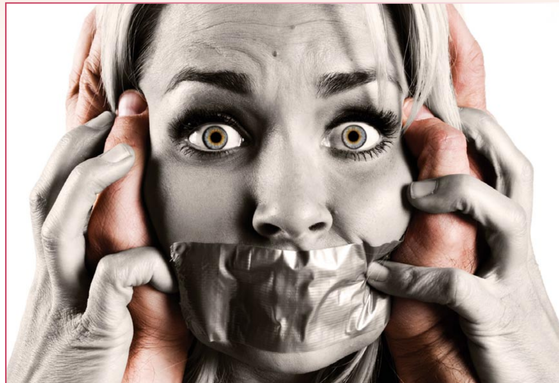
فيلبي / ياسر عماد

أن تسكن الأسرة في دار واحدة"، موضحة أن "الفتاة مثلاً حين تتزوج لا تنقطع بينها وبين أهلها الروابط الأسرية وبالتالي إذا تعرضت إلى عنف من قبل أهلها يحق لها تقديم شكوى ضدهم".