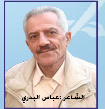
الشاعر: عباس البدري

قدحا خمر غدرا بي في حانات الدنيا: قدح في شيراز، وآخر في كوردستان، فأما القدح الكوردستاني فبين طريق النبع، وأشجار الكرز الدامي ليلة ودعني قمر بغدادي أوجعه العشق. وأما القدح الشيرازي ففي ذكرى الشعراء المغدورين، صحابتنا، حلفاء الشجر الطيب، ان الشعراء المغدورين تطاردهم فرق الاعدام، فكل قصيدة حب غارقة بالدم، ونصب الحرية طشره الدم، وبغداد ترن، محطة بغداد، كما قدح القاه السكير الارعن في الحانة، كيف يرن الدم على المرمر، بغداد ترن، سقاة الحانة تعثر ارجلهم بالجلث المطروحة، هؤلاء تداولهم غدر الخناقين باسم الرأفة، باسم حمامات الزاجل، يشطرها السهم، فضل المدينة يعثر بالجرح... ووفرة قتلى... شعراء، اعمدة الحكمة،