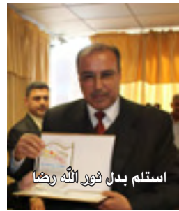
استلم بدل نور الله رضا