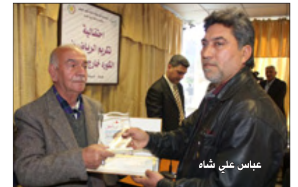
عباس علي شاه