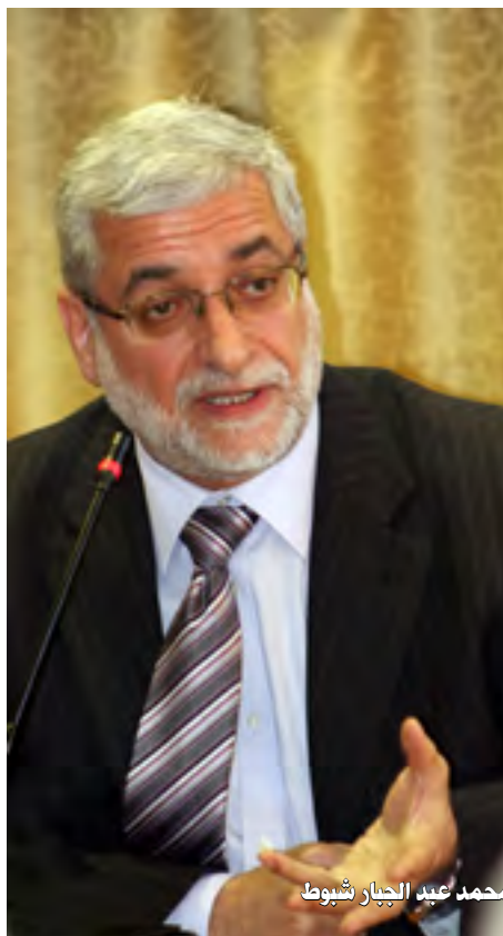
اعداد : فهيلي

شهدت العملية السياسية بعد سقوط نظام صدام المدوكي تجاذبات وصراعات عديدة بين القوى والاحزاب السياسية اتسمت في احايين وظروف مريرة بسلوكيات لاتمت الى الديمقراطية بصلة رغم ان هذه القوى والاحزاب ركبت صهوة الديمقراطية كوسيلة للوصول الى السلطة.