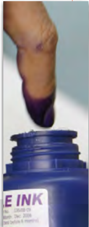
العدد ١٠٠٩ السعة السابعة (كارتون للفنان ٢٠١١)

- بشأن المادة ١٤٠ هناك من يقول ان مدتها قد انتهت؟ * هذا غير صحيح من الناحية القانونية ومن يقول ذلك فهو اما جاهل او متجاهل في علم عملية التوعية الكاملة في وسائل الاعلام في ماهية الدستور. وماذا يريد في المستقبل؟ - تشير خبراء قانونيون وناشطون في الحقوق المدنية وفي حقوق الانسان ان هناك بعض فقرات الدستور تتناقض مع بعضها الاخر مثلاً في موضوع الحريات المدنية الدستور يؤكد على صيانة الحريات المدنية وفي نفس الوقت هنالك فقرة اخرى تتحدث عن الاعتراف والاعمال على ايجاد حلول وتطبيقات لهذه المادة باليات اخرى او باصدار تعديل جديد ضمن احكام المادة ١٤٢ بتصدية الفترة الزمنية في عملية تطبيق احكام المادة (١٤٠) واما انتهاء هذه المادة فهذا كلام غير دقيق وغير صحيح من الناحية الدستورية والقانونية.