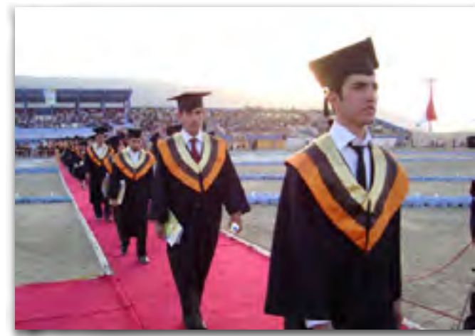
العدد ١٠٠ السنة السابعة (كانون الثاني ٢٠١١)

وخلق حركة بحث علمي نشيطة ومتساعده الاهمية لكي تصبح جامعاتنا على قدم المساواة مع النشاطات العلمية العالمية وتحويل الأساتذة الى علماء عاملين فاعلين لهم بصماتهم واثرمهم في الصرح العلمي ومساهماتهم الواضحة في مجال التنمية والتطور الذي يفيد الانسانية ويسبغ عليها الطمأنينة ويؤدها باقائين العيش السعيد والحياة المنعمه من خلال الابتكارات العلمية الخلاقة . فضلاً عن ايجاد مدارس بحثية في كافة المجالات ذات الاهمية المبنية على أسس الاهداف الوطنية في مضمار الأبحاث المتطورة .