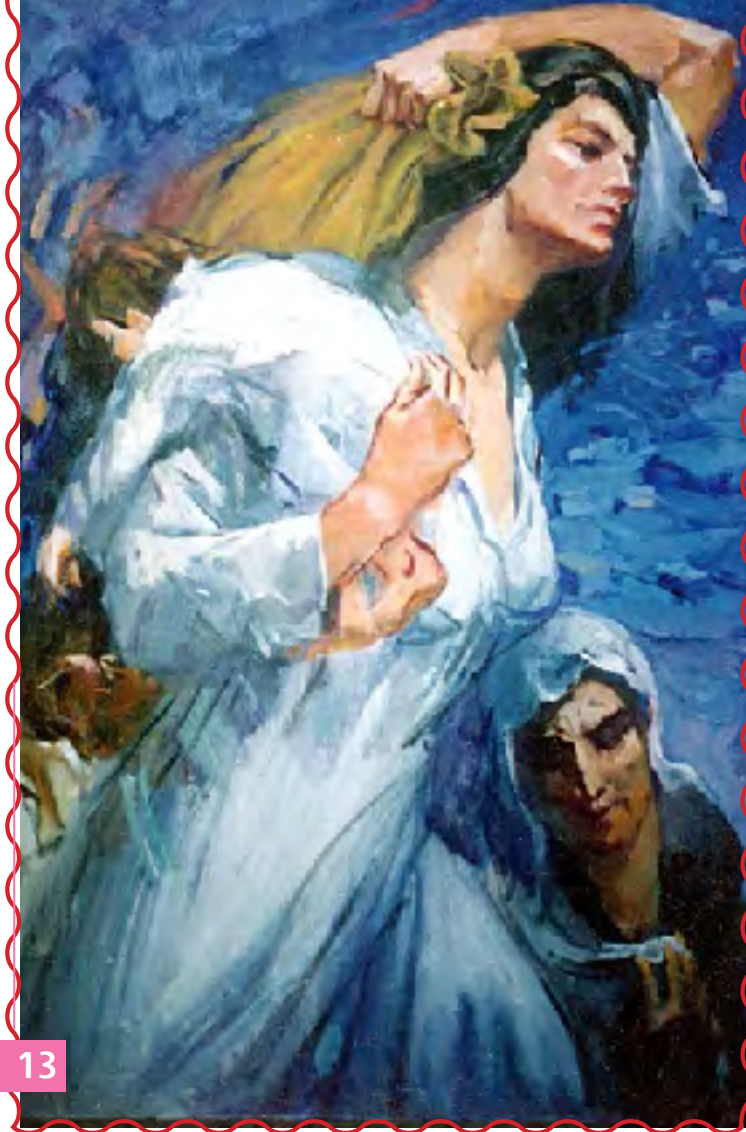
العدد ١٠٠٩ السعة العاشرة (كارتون للفنان ٢٠١١)