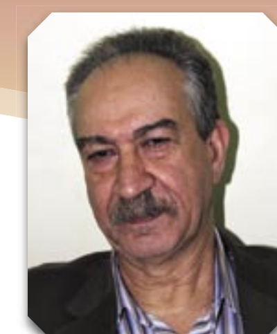
صباح مندلاوي : نقيب الفنانين العراقيين

ومن خانقين هنا السيد أكرم محمود الأمين السابق لمكتبة خانقين العامة صدور العدد مئة من الفيلى المجلة التي شغلت حيزاً كبيراً في الثقافة الكوردية ونالت من إعجاب وتقدير الطليعة المثقفة في المدينة مباركاً للعاملين فيها هذا الجهد الخير .