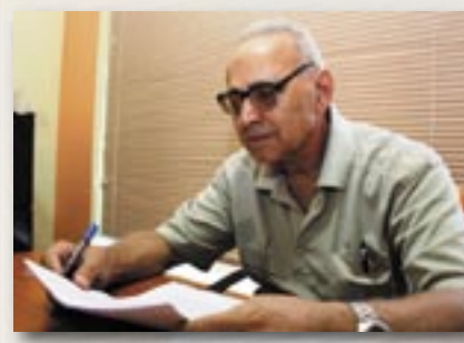
التنقيح اللغوي:محمد علي السماوي

انفردت مجلة ((فيلي)) بكونها أكثر المطبوعات التي نقلت وتنقل معاناة وهموم شريحة الكورد الفيليين بصورة خاصة . والكورد ككل بصورة عامة . فضلا عن شرح وتبيان أصالة هذه الشريحة التي حاولت وحاولت جهات عدائية شوفينية معروفة للجميع طمس هويتها الأصيلة كواحدة من القوى العريقة في تاريخ هذا البلد . بالاضافة لكونها على تماس مباشر بأمال وطموحات طبقة اجتماعية تعاني العزلة الاعلامية من باقي وسائل الاعلام المرئية والمسموعة والمقروءة . نأمل أن تجد كتاباتنا في هذه المجلة الطرق الكفيلة والسهلة والبسطة في نقل الأصوات التي كتمت أفواهاها لفترة طويلة من الزمن عسى أن تصل الى أيدي المسؤولين في البلد لاحقاق الحق ونصرة شريحة الكورد الفيليين المظلومة ..