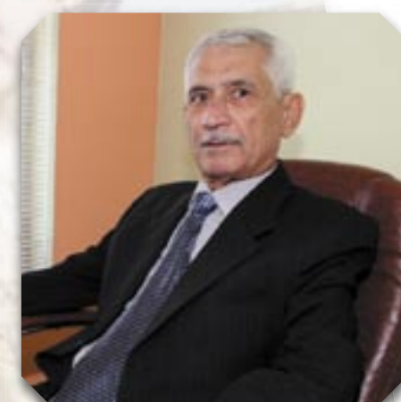
مدير التحرير: فريدون كريم