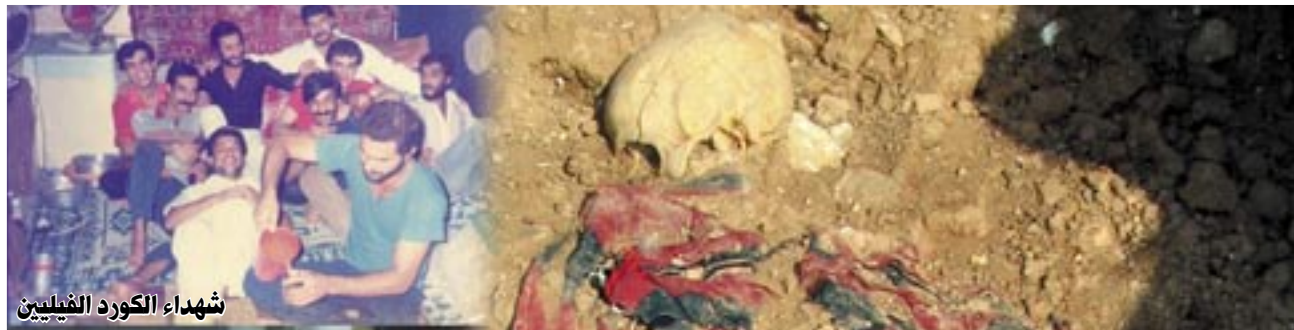
شهداء الكورد الفيليين

بعد سقوط الدكتاتورية وإلغاء العديد من القرارات الصادرة في زمن النظام الدكتاتوري لازال البعض من العراقيين يعانون من تبعات تلك القوانين الجائرة منهم أحد الضباط السابقين في الجيش العراقي من الشرفاء الذين رفضوا إغراءات النظام السابق وطردوا من الجيش بسبب إنتماء زوجاتهم الى عوائل مهجرة خارج